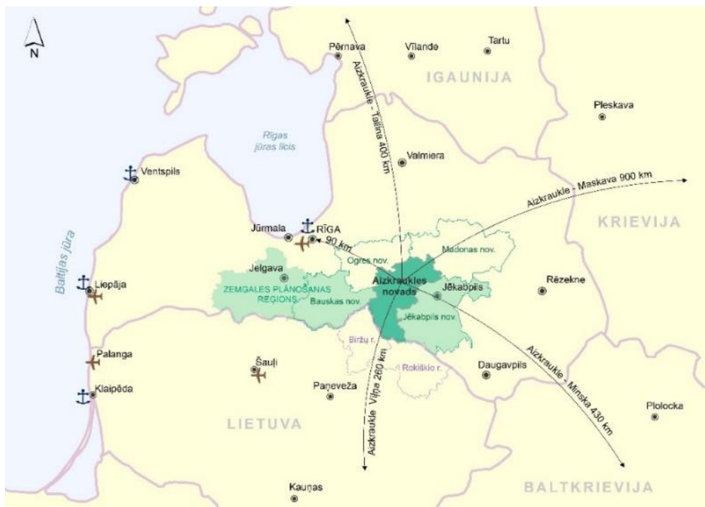
1. attēls. Jaunveidojamā Aizkraukles novada novietojums Latvijā (SIA "Baltkonsults")

Jaunveidojamais Aizkraukles novads atrodas Latvijas vidienē (1. attēls), izvietojies abos Daugavas krastos.