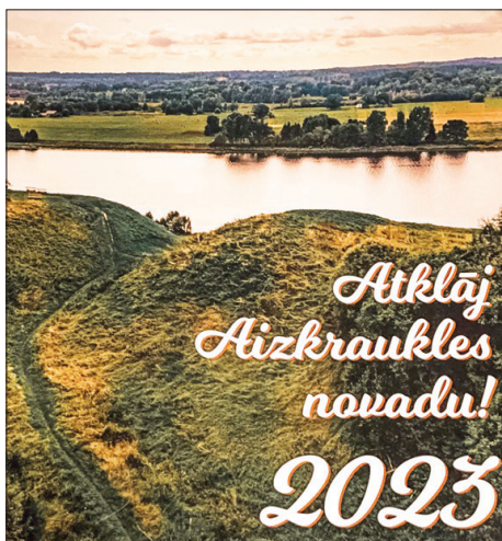
JAUNAIS Aizkraukles novada kalendārs reizē ir tūrisma ceļvedis.

* Skrīveru tūrisma informācijas punktā – Skrīveros, Daugavas ielā 85;