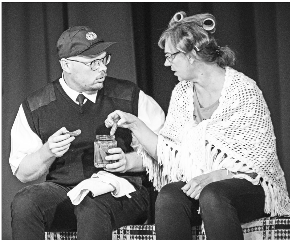
"MUITNIEKA MĀJA". Skats no Jaunjelgavas kultūras centra amatierteātra "Spēlmaņi" izrādes.