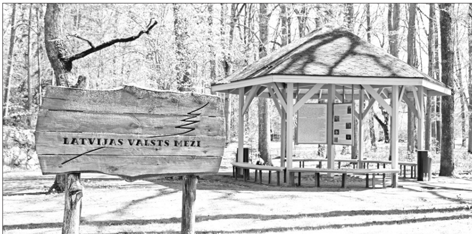
SKRĪVERU DENDROLOĢISKAIS PARKS ir skaists visos gadalaikos.