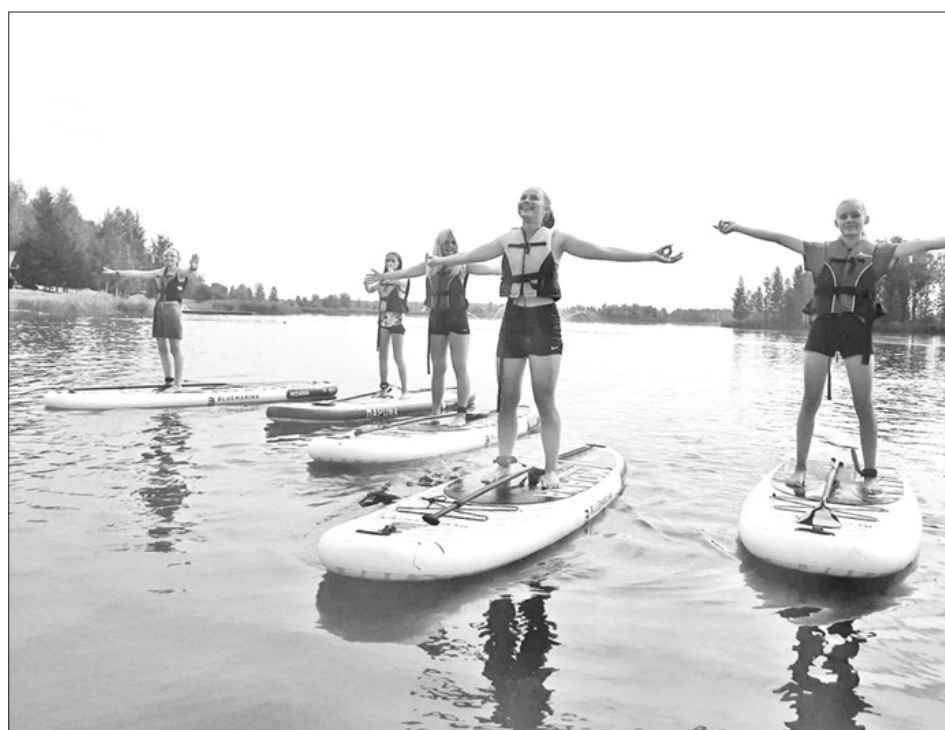
JAUNIEŠI vienā no projekta aktivitātēm.

Projekta “Viena iespēja VISIEM!” mērķis bija integrēt jauniešus ar ierobežotām iespējām aktīvo jauniešu kopienā,