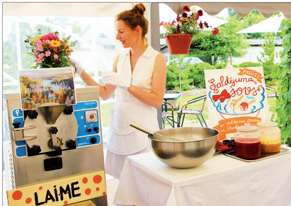
MĀJAS KAFEJNĪCU DIENĀS uzņēmuma "Skrīveru mājas saldējums" kafējnīcā ikviens varēja vērot īpašu saldējuma tapšanas šovu.

Novembris ierasti ir laiks, kad pirms gaidāmās ziemas izvērtējam aktīvo tūrisma sezonu. Aizkraukles novada Tūrisma nodaļa var atskatīties uz pirmo darbības gadu, bet kopīgi sākam darboties jau pērnā gada nogalē, kad veidojām mājaslapu www.visitaizkraukle.lv , kur apkopota informācija par novada tūrisma piedāvājumu, kā arī veidojām Aizkraukles novada tūrisma karti. Mājaslapā pieejama arī kultūras pasākumu programma, izveidoti novada tūrisma informācijas "Facebook" un "Instagram" konti, kur tiek publicēta aktuālā tūrisma informācija.