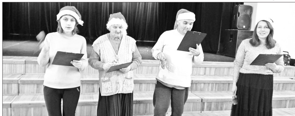
SVEICIENU pārejiem bija sagatavojis katrs pasākuma viesis, savu priekšnesumu rāda Kokneses Ģimenes atbalsta dienas centrs.