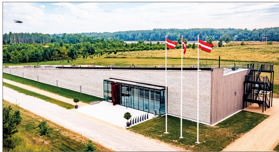
LIKTEŅDĀRZA SAIETA NAMS, kas atvērta šovasar, veidots kā kalns vai tilta sākums un simboliski iemieso Likteņdārza ideju – no pagātnes uz nākotni.

Šoruden atklāts multifunkcionālais veloparks. Objekts vizuāli veidots kā Dau-