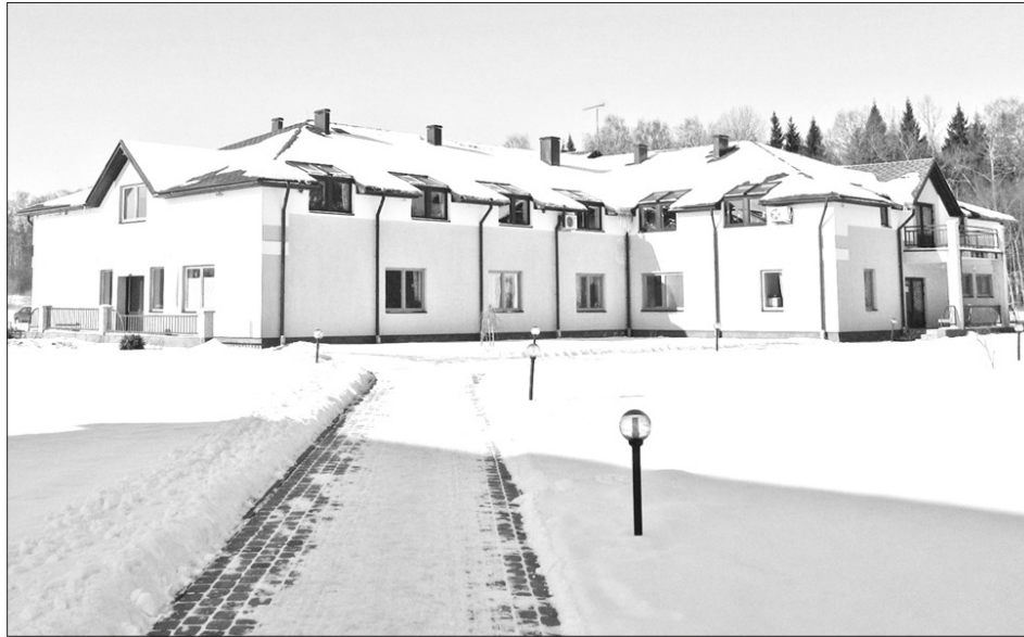
ZIEDUGRAVĀS drīz sāks būvēt jaunu korpusu.

2020. gadā sociālās aprūpes centrs “Ziedugravas” guva iespēju iesaistīties ASV Bruņoto spēku pavēlniecības Eiropā finansētajā projektā, kuru īsteno Cīvilās sadarbības programmas ietvaros. Viens no projekta mērķiem ir uzlabot iedzīvotāju pamatvajadzības veselības vai sociālā atbalsta iestādēs. Viens no nosacījumiem, lai “Ziedugravas” pretendētu šī projekta īstenošanai, bija pašvaldības apliecinājums, ka infrastruktūra ir valsts vai pašvaldības īpašums, kā arī pašvaldība finansēs neatkarīgu būvuzraudzību un turpmākā atjaunoto ēku vai citu projektā veikto remontdarbu uzturēšana notiks par pašvaldības līdzekļiem. Lai nostiprinātu iegūtās tiesības sadarbībai ar ASV Bruņoto spēku pavēlniecību Eiropā, Aizkraukles nova-