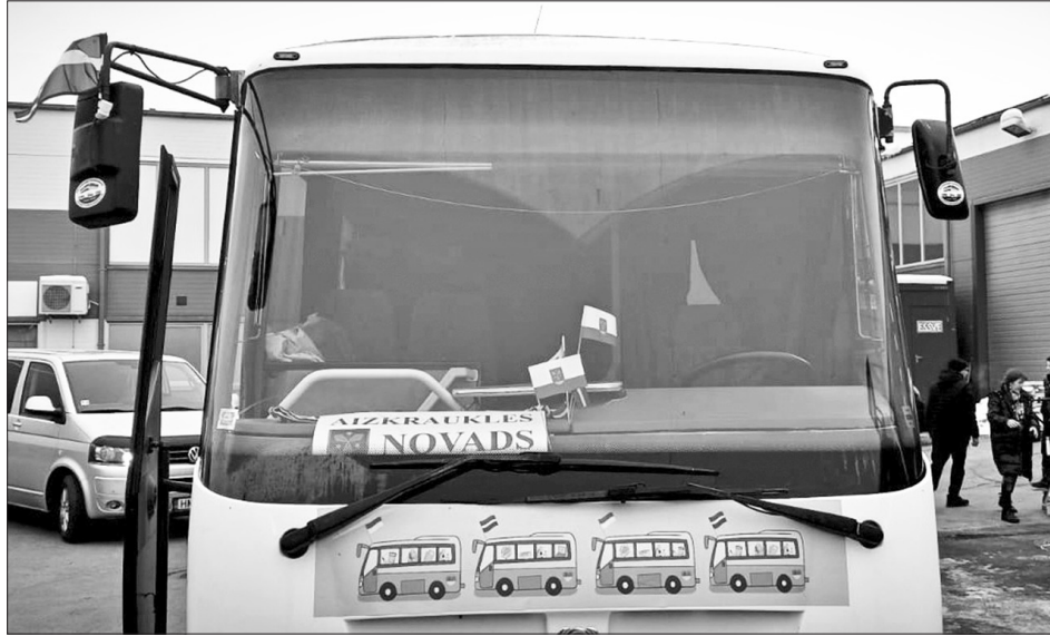
PALĪDZĪBA DRAUGIEM. Autobuss, kuru piepildījuši Aizkraukles novada iedzīvotāji, pirms došanās ceļā uz Slavutiču.

Cilvēki sarūpēja silto apģērbu un apavus, lukturišus un sveces, skolas piederumus, rokdarbnieces adīja siltas zeķes un cimdus. Viss novads sadevās rokās, lai palīdzētu, un uz Aizkraukli tika sūtītas pakas, saiņi un vedumi no skolām, bērnodārziem, iestādēm, kopienām, privātiem ziedotājiem no visām novada pil-