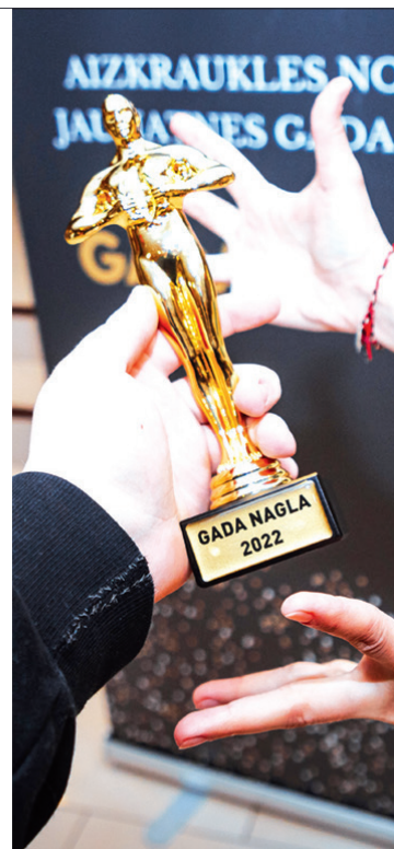
BALVA “Gada Nagla”.

pā ar citiem jauniešiem sniedza atbalstu arī Ukrainas jauniešu uzņemšanā Aizkraukles novadā.