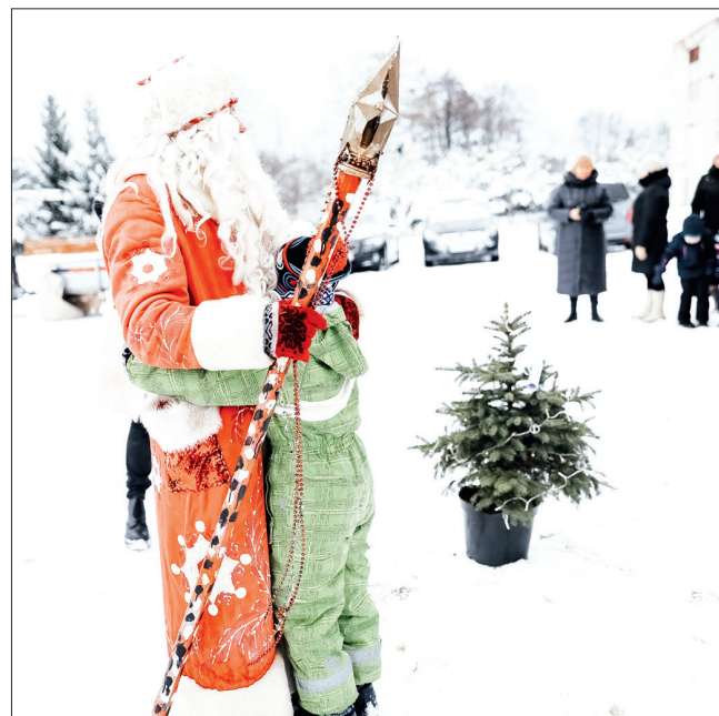
MĪLĪ. Kad Skrīveru bērnudārzā “Sprīdītis” Ziemassvētku vecītis jautāja, vai kāds grib viņam kaut ko pavēstīt, bērni metās vecīti samīļot.