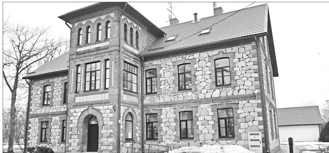
KOKNESES ĢIMENES ATBALSTA DIENAS CENTRA ēkā paredzēts izbūvēt ārējo vertikālo pacelēju ar trīs pieturām.

Aizkraukles novada pašvaldības Attīstības nodaļas projektu vadītāja