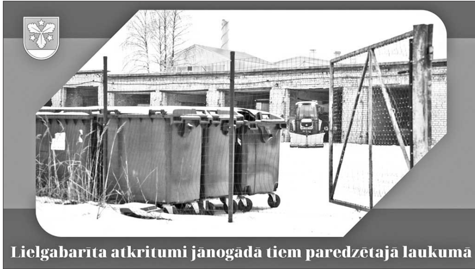
Lielgabarīta atkritumi jānogādā tiem paredzētajā laukumā

Saskaņā ar Aizkraukles novadā pieņemtajiem saistošajiem noteikumiem Aizkraukles pilsētas teritorijā jebkāda veida atkritumus aizliegts novietot ārpus konteineriem. Tas attiecas arī uz lietām, ko nevar ietilpināt atkritumu konteineros – nolietotajām mēbelēm un citiem lieltgabari atkritumiem. Iedzīvotāji šo aizliegumu gan dažkārt ignorē, un lieltgabari atkritumi tiek izlikti pie konteineriem laukumos pilsētas centrā, līdz ar to radot nepievilcīgu pilsētvidi un sagā-