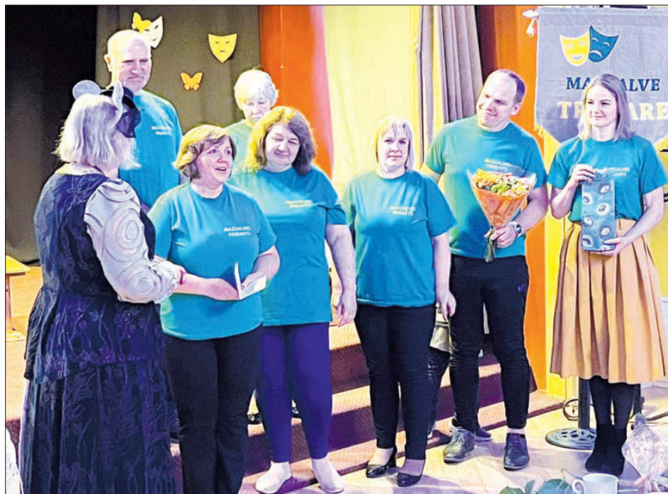
“TRADARE” aktieri jubilejas svinībās.