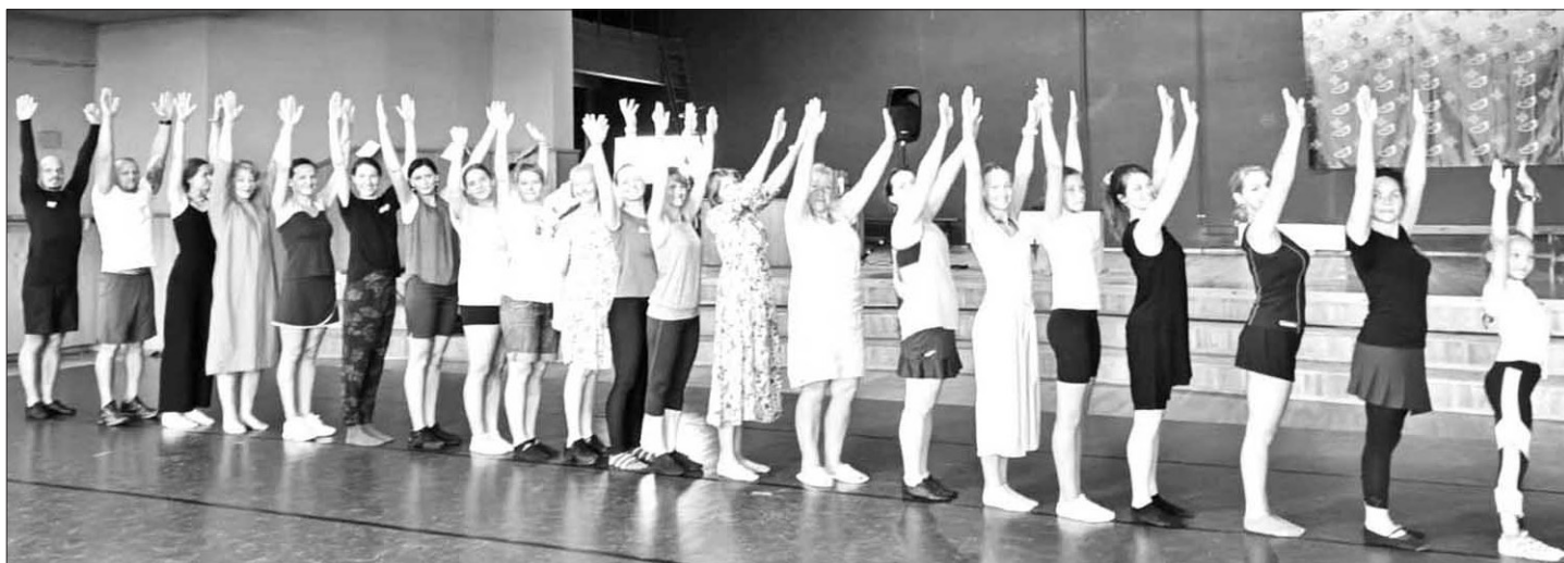
MEISTARKLASĒ "Ķermeņa kustību loma amatiermākslā".