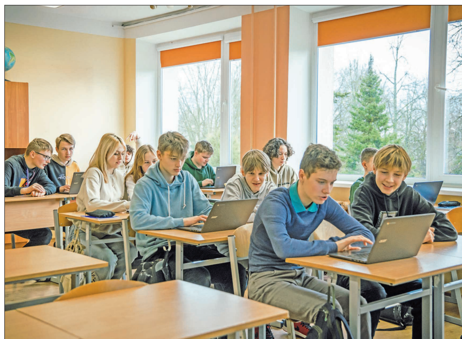
JAUNOS DATORUS skolēni izmantos stundu laikā mācību satura apguvei. Mācību stunda Aizkraukles novada vidusskolā.