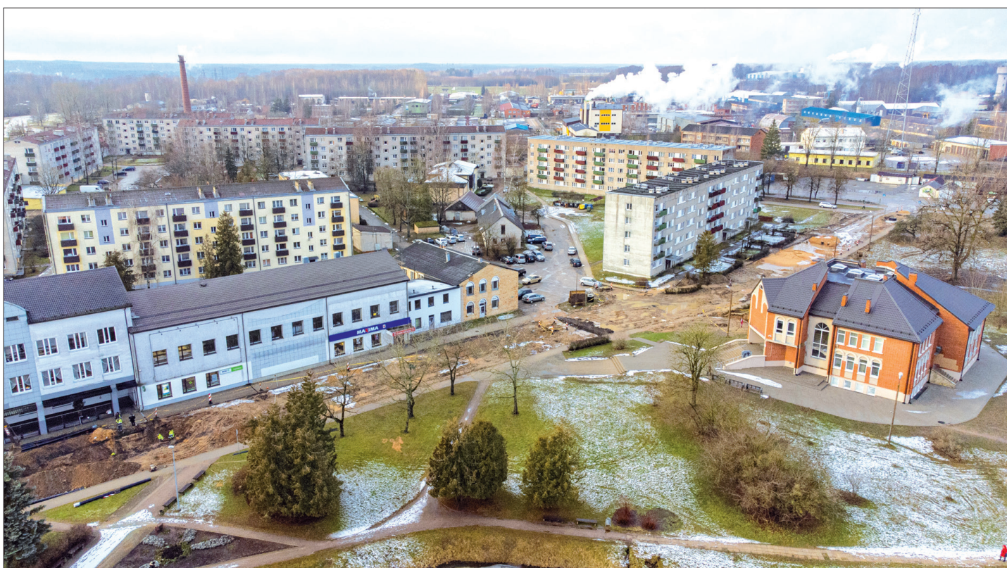
TOP! Līdz ar Skolas ielas atjaunošanu Aizkraukle iegūs vēl vienu sakārtotu teritoriju.

Projekta “Teritoriju revitalizācija, reģenerējot degradētās teritorijas – ielu infrastruktūras pielāgošana uzņēmējdarbības attīstībai II kārtā” Nr. 5.6.2.0/22/I/012. Tas tiek īstenots ar Eiropas Reģionālās attīstības fonda finansiālu atbalstu.