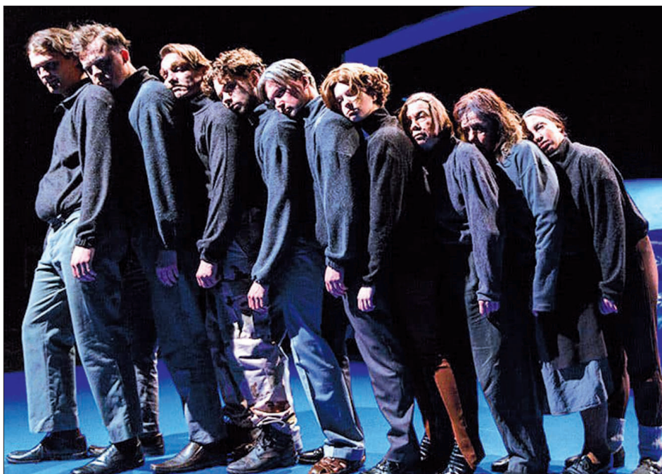
“KALENDĀRS MANI SAUC” – skats no Valmieras Drāmas teātra izrādes.

Savukārt 13. martā pulksten 19 Aizkraukles kultūras centrā būs skatāma