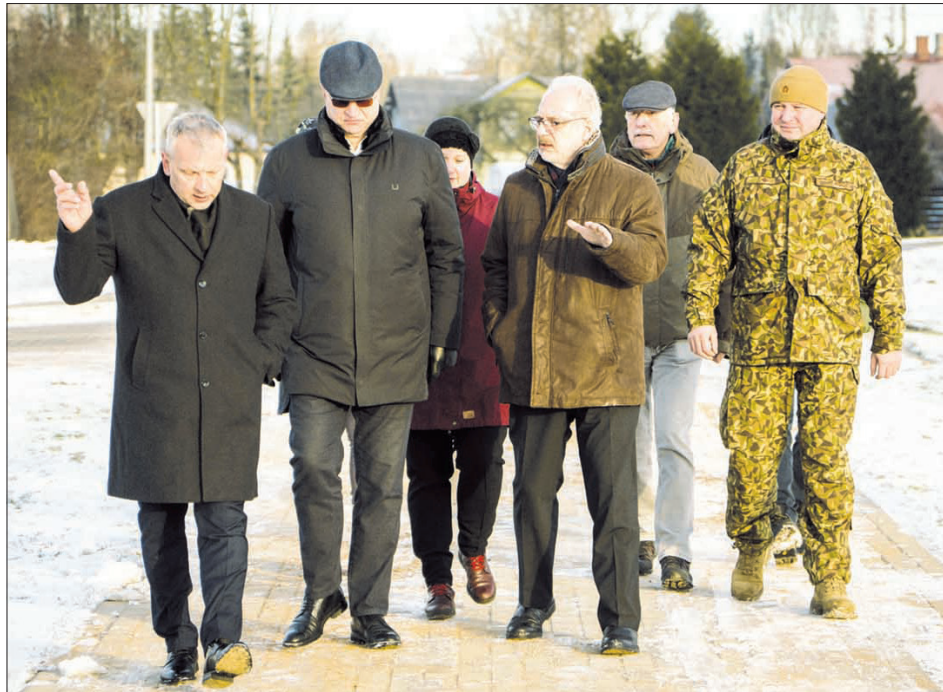
PĻAVIŅĀS Valsts prezidents Egils Levits (vidū) tikās ar pašvaldības vadību un iepazīna situāciju saistībā ar plūdu draudiem.

Apskatot aizsargdambi Pļaviņās, pašvaldības pārstāvji informēja Valsts prezidentu par jau gatavu projektu turpmākai Daugavas krasta nostiprināšanai Gostiņu virzienā. Tas varētu būtiski mazināt gan pilsētas applūšanas riskus, gan novērst turpmāku upes krasta noārdīšanos, šī iemesla dēļ tuvākajos ga-