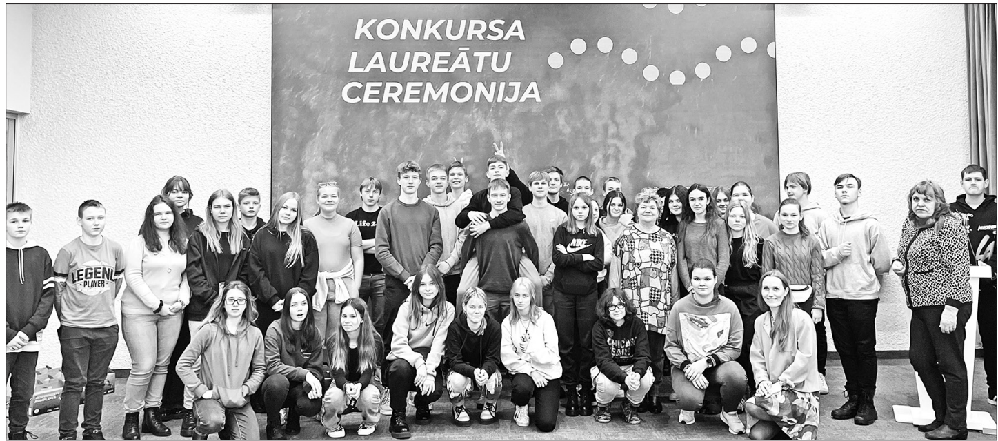
KONKURSA LAUREĀTI zinātnes centrā "Vizium" Ventspilī.

Par dalību konkursā katrs skolēns balvā saņēma eksperimentu komplektu, ar kura palīdzību var veikt ūdens kvalitātes mērījumus, kā arī uzzināt, kā izmantot ūdens enerģiju un elektrolīzes procesā iegūt ūdeņradi. Pasākuma laikā skolēniem bija iespēja uzspēlēt "Kahoot" spēli un iegūt individuālas balvas. Noslēgumā visi dalībnieki apmeklēja zinātnes centra "Vizium" radošo darbnīcu un ekspozīcijas zāli.