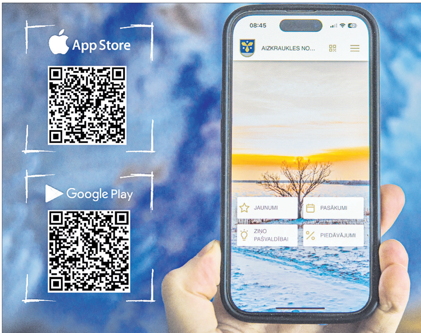
NOSKENĒ UN IZMANTO jauno lietotni!

Šomēnes aplikāciju veikalos “Play veikals” un “App store” bezmaksas lejupielādei ievietota Aizkraukles novada mobilā lietotne “Aizkraukles novads”. Lietotne darbosies viedtālrunos, planšētdatoros, e-lasītājos un citās ierīcēs. Novada viesus, bet jo īpaši Aizkraukles novadā deklarētos iedzīvotājus aicinām lejupielādēt jauno aplikāciju, jo iecerēts, ka tieši deklarētiem iedzīvotājiem ar lietotnes palīdzību būs iespējams saņemt priekšrocības un atlaides pašvaldības iestādēs un pie pašvaldības sadarbības partneriem – uzņēmējiem.