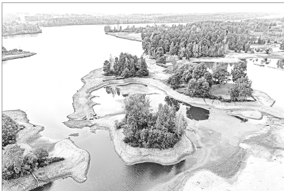
DAUGAVĀ pie Pļaviņu HES vasaras otrajā pusē plānots pazemināt ūdens līmeni.

Ūdenslīmeņa pazeminājuma periodi izvēlēti, labākajā veidā salāgojot sabiedrības un koncerna intereses, jo hidrotehnisko būvju atjaunošanas un ap-