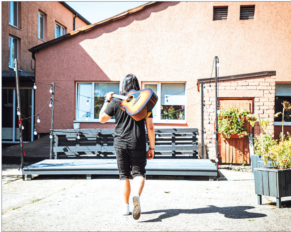
LABAS IDEJAS. Pērn Aizkraukles jaunieši īstenoja ideju par skatuviņas izveidošanu sociālā dienesta ēkas pagalmā. Šogad tiek gaidītas citas jauniešu iniciatīvas un idejas, kuras pašvaldība labprāt atbalstīs.

Aizkraukles novada dome 16. marta sēdē apstiprināja jauniešu iniciatīvu konkursa nolikumu. Tā mērķis ir sniegt finansiālu atbalstu Aizkraukles novada jauniešu iniciatīvu ideju realizācijai, veicinot jauniešu līdzdalību novada kultūras, sporta, izglītības un sabiedriskajos procesos. Konkursu īsteno un adminis-