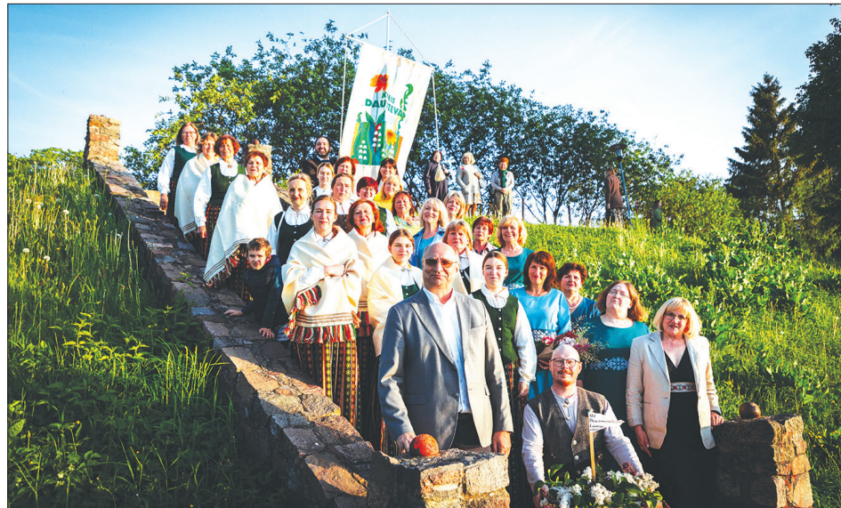
SVĒTKI SĀKĀS JAUNJELGAVĀ. 27. maijā visas dienas garumā Jaunjelgavas apvienību caurvija "Vasarsvētku dziesmas ceļš". Vīri un sievietes no trijiem koriem un sešiem vokālajiem ansambļiem pieskandināja visus Jaunjelgavas apvienības pagastus, bet vakarā pulcējās uz Jaunjelgavas kultūras centra skatuves, lai izdziedātu skaistākās latviešu dziesmas. Te dziedāja "Dzīrnas" no Klīntaines, "Mežaroze" no Sunākstes, "Zīle" no Vietalvas, Mazzalves un Jaunjelgavas kultūras centra vokālais ansamblis, "Ferrovia" no Skrīveriem, "Vīgante" no Seces, "Loreleja" no Pļaviņām un "Daudzeva" no Daudzeses. Vēlāk simbolisks svētku gājieni devās uz Daugavmalu, lai likteņupē palaistu svecēm un cerīnziēdiem rotātu dziesmas plostu, kas dziesmas skanējumu tālāk nesīs uz Rīgu. Foto priekšplānā – Aizkraukles novada domes priekšsēdētājs Leons Līdums (no kreisās), svētku lielkoncerta koordinators un vadītājs Eduards Kaļķis un Aizkraukles novada Kultūras pārvaldes vadītāja Anta Teivāne.