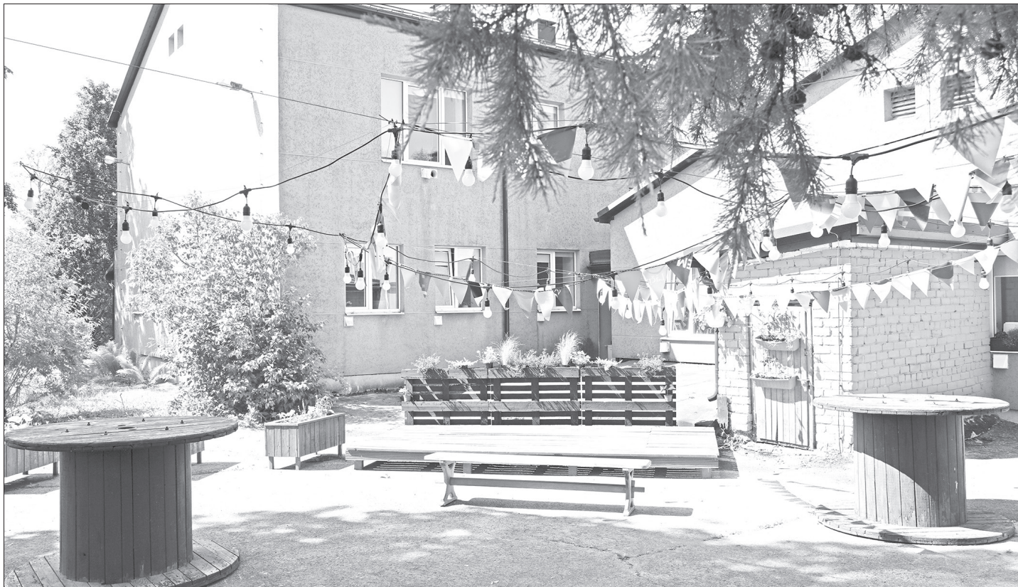
LAI BŪTU KUR! Jaunieši iecerējuši labiekārtot viņu rīcībā nodotās garāžas teritoriju.