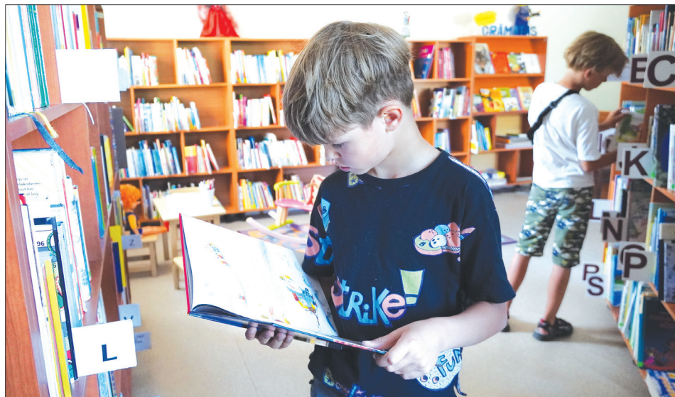
BIBLIOTĒKAS BĒRNU NODAĻU plānots iekārtot iedvesmojošu un košu, lai tajā būtu vēl patīkamāk uzturēties.

A izkraukles novada centrālā bibliotēka piedalīsies projektu konkursā “iedvesmas bibliotēka”, lai iegūtu līdzekļus bibliotēkas bērnu nodaļas telpu remontam un aprīkojumam.