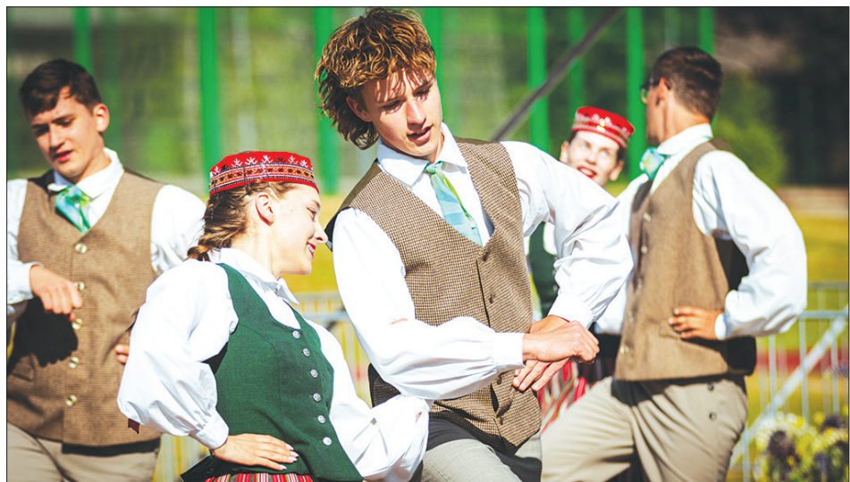
SKRĪVEROS 10. un 11. jūnijā svētkus un vasaru ieskandināja Skrīveru Mūzikas un mākslas skolas audzēkņi, absolventi un pedagogi. Koncertā vidusskolas stadionā muzicēja un dejoja tautas mākslas kolektīvi no Skrīveriem un citām novada vietām. Skrīveros tikās dažādu stilu dejojāji – koncertā piedalījās deju kopa "Aiva", deju kolektīvs "Kvēlziedes" no Daudzeses, linijdeju kolektīvs "Balzāms dvēselei" no Seces un "Jaurās vecmāmiņas" no Aizkraukles. Skaists un emocionāls bija tautu deju kolektīvu uzvedums, Skrīveru kultūras centra tautas mākslas kolektīvu un vidusskolas skolēnu, pūtēju orķestra "Skrīveru taurētājs" koncerts. Vakara izskaņā skanēja Intara Busuļa koncerts. To klausījās un līdzī jūta apmēram pusotrs tūkstošis apmeklētāju. Foto: deju Skrīveru jauniešu deju kolektīvs "Dižsusuri", priekšplānā – Mārtiņš Kaķis un Terēze Barkāne.