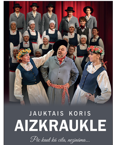
JAUKTAIS KORIS AIZKRAUKLE Pēc kaut kā cēla, nezināma...