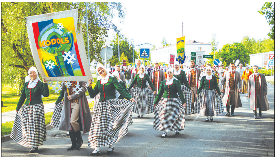
AIZKRAUKLĒ divās svētku dienās bija iespēja vērot vairākus koncertus un iesaistīties dažādās interesantās nodarbēs un svarīgs svētku brīdis bija gājieni, kas aizvijās cauri visai pilsētai. Tajā devās 20 deju kolektīvu un apmēram 30 iestāžu pārstāvji no visa plašā Aizkraukles novada. Gājienā piedalījās arī draugu delegācijas no Polijas un Birziem Lietuvā, arī dejojāji no Lēdmanes. Gājienā kopības sajūtu izbaudīja amatiermākslas kolektīvi, izglītības iestāžu, privātuzņēmumu un pašvaldības iestāžu pārstāvji, sportisti. Foto: svētku gājienā dodas deju kolektīvs "Kodols" no Jaunjelgavas.