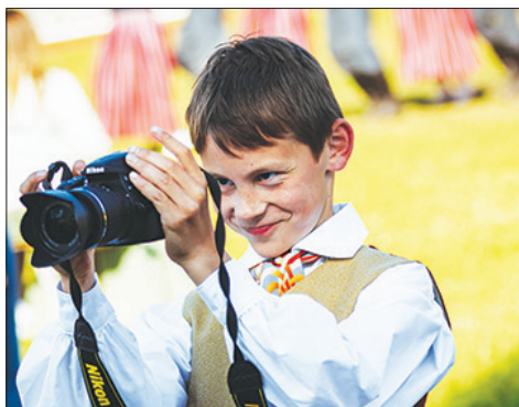
SVĒTKOS interesantas nodarbes un priecīgus brīžus izbaudīja lieli un mazi apmeklētāji.