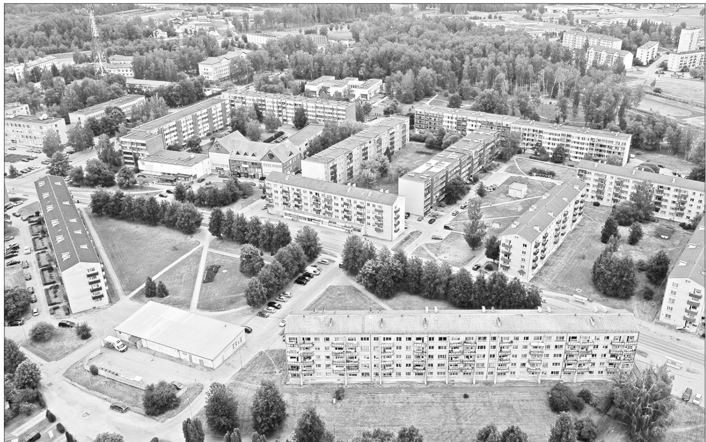
AIZKRAUKLĒ pašvaldībai pieder apmēram 300 dzīvokļu.

Aizkraukles novada pašvaldības oficiālajā tīmekļa vietnē www.aizkraukle.lv ikviens var izlasīt jauno saistošo noteikumu projektu "Par Aizkraukles novada pašvaldībai piederošo dzīvojamo telpu izīrēšanas kārtību", "Par Aizkraukles novada pašvaldības īpašumā vai valdījumā esošo dzīvojamo telpu īres maksas noteikšanas kārtību" un paskaidrojuma rakstus, kā arī līdz šī gada 27. jūnijam izteikt savu viedokli, to iesūtot e-pastā dome@aizkraukle.lv . Vēlāk iesniegtie viedokļi netiks vērtēti.