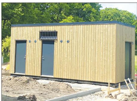
KOKNESĒS PARKĀ drīzumā būs arī labierīcības.

Par publikācijas saturu pilnībā atbild Aizkraukles novada pašvaldība un tā nekādos apstākļos nav uzskatāms par Eiropas Savienības oficiālo nostāju.