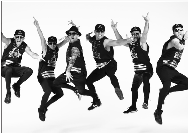
DIENAS NOSLĒGUMĀ Aizkraukles pilsētas stadionā muzicēs grupa “Bermudu divstūris”.

Sīkāka sporta svētku programma vēl tiks izziņota, tās būs ievietota mājaslapās www.aizkrauklessportacentrs.lv un www.aizkraukle.lv , kā arī sociālo tīklu kontos.