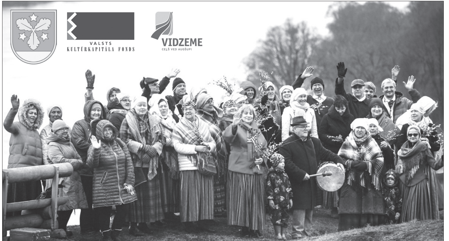
AIZKRAUKLES PILSKALNĀ šajā pavasarī pirmo reizi svinēta Lībiešu mantojuma diena.

Projekta ietvaros izveidota darba grupa lībiešu atstātā kultūras materiāla apzināšanai un kartēšanai, piesaistot Latvijas zinātniekus, kuri pārstāv vēstures, kultūras, valodniecības un etnoloģijas