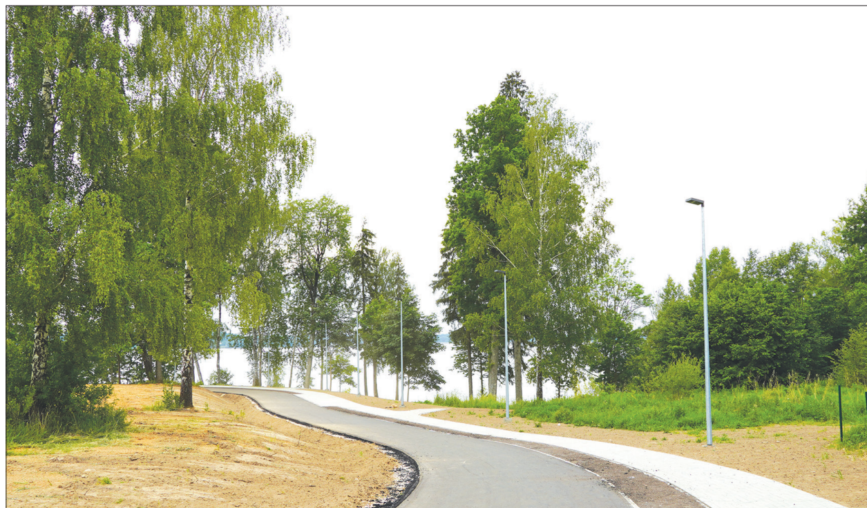
ATPŪTAS VIETĀ pie Daugavas Aizkrauklē lokveida aplim uzklāts asfalta segums.