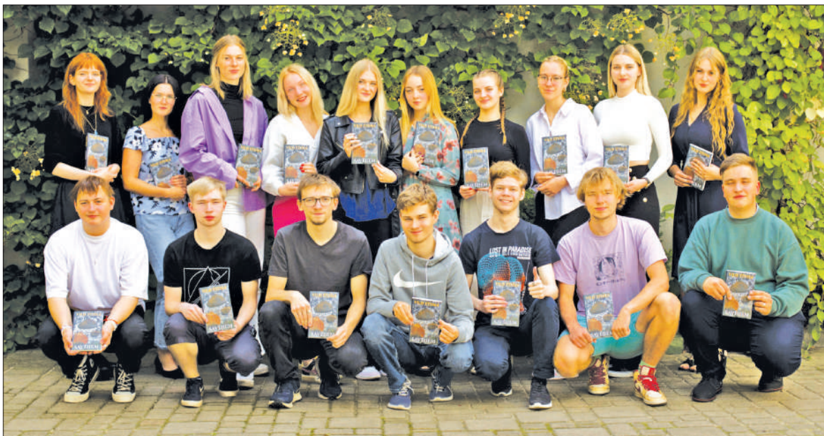
LĪGUMA PARAKSTĪŠANAS DIENĀ daļa no pirmā kursa studentiem – Vītolu fonda stipendiātiem.

J auno mācību gadu ar Vītolu fonda administrētajām stipendijām Latvijas augstskolās sāka 860 studenti, viņu vidū arī 36 jaunieši no Aizkraukles novada.