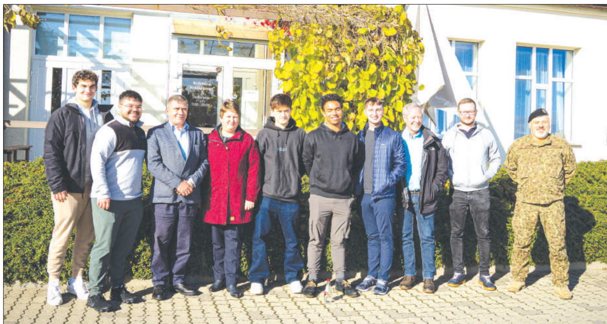
ASV STUDENTI iepazīst Aizkraukles novadu un tiekas ar pašvaldības un Zemessardzes pārstāvjus.

Starptautiskajās attiecībās ierasts, ka sarunas labāk vedas pie pusdienu galda, tādēļ viesi uzaicināja pašvaldības un vietējā Zemessardzes bataljona pārstāvjus darba pusdienās. Tikšanās laikā jaunieši uzzināja par Aizkraukles novada rašanos un pārvaldes formu, pašvaldības viedokli par militārā poligona būvniecību novadā. Studenti interesējās arī par cittautiešu integrāciju novadā, kā arī valsts aizsardzības dienesta atjaunošanu un tā ietekmi sabiedrībā.