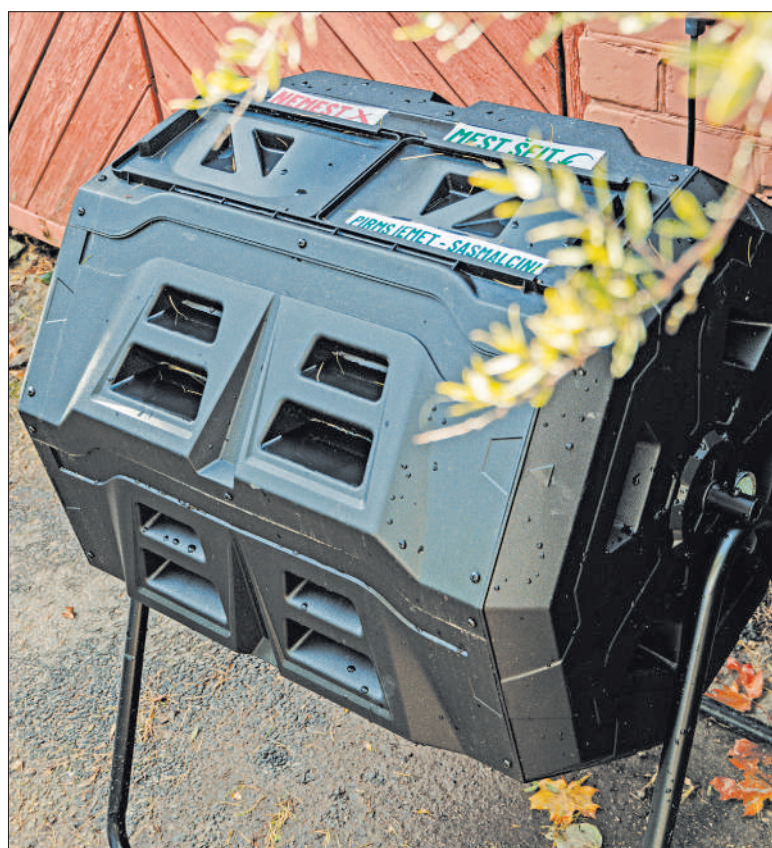
KOMPOSTA KASTE ir piemērota pilsētvidei, un tajā tiks iegūts mēslojums puķudobēm.