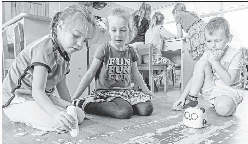
ROBOTI PALĪDZ MĀCĪTIES. Apģūstot dažādas prasmes, robots Pandiņa un citi roboti ir lieliski palīgi.

"Sprīdītī" ir iegādāti roboti, kas atgādina mazus dzīvnieciņus, un bērni no 3 līdz 7 gadu vecumam ar to palīdzību