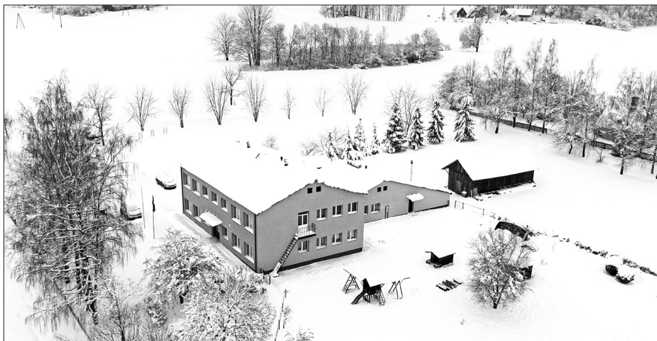
VIETALVAS "PAGASTMĀJA". Ēka ir siltināta, atjaunots jumts un uz tā izbūvēta solārā sistēma ūdens sildīšanai.