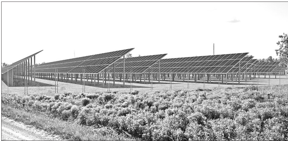
KOKNESES SAULES ELEKTROSTACIJAS vizualizācija.

"Kokneses SES" īpašnieks ir pašmāju investīciju fonds "Merito Sustainable Energy Fund I", šobrīd lielākais saules elektrostaciju operators Latvijā, kas iecerēts īstenošanai piesaistīt pieredzējušus ekspertus no uzņēmuma "Saules Energy". "Kokneses SES" projektā investēti vairāk nekā 4 miljoni eiro, tostarp Attīstības un finanšu institūcijas ALTUM aizdevums uzņēmumu ilgtspējai 2,1 miliona eiro apmērā.