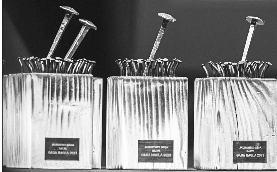
KLŪSTI PAR ZELTA NAGLU! Balvā "Gada nagla 2023" simboliski atveidota zelta nagla starp daudzām citām naglām – par zelta naglu var kļūt katrs jauniešs, kurš ar saviem darbiem ir paveicis vairāk nekā citi jaunieši.

✦ Daija Krieviņa – aktīvi piedalās un iesaistās dažādos Skrīveru jauniešu telpas rīkotajos pasākumos un labprāt at-