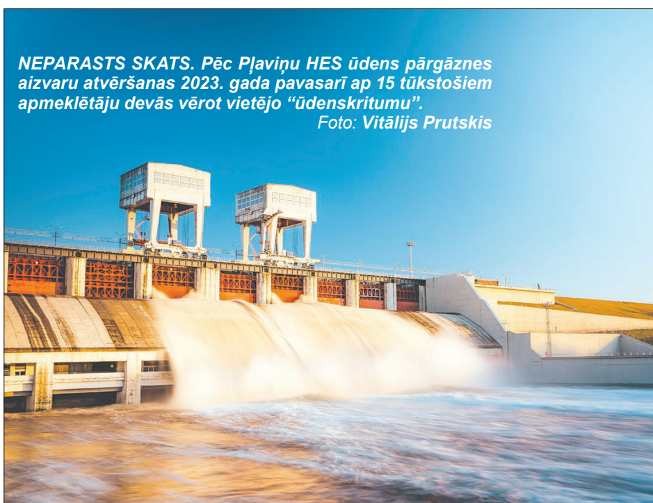
NEPARASTS SKATS. Pēc Pļaviņu HES ūdens pārgāznes aizvaru atvēršanas 2023. gada pavasarī ap 15 tūkstošiem apmeklētāju devās vērot vietējo "ūdenskritumu".

"Leģendu naktī" Kokneses pilsdrupās multimediāls gaismu uzvedums aizveda ceļojumā "Laimi meklējot". Novembrī Likteņdārzā notika vērienīgs valsts svētku pasākums – gaismas uzvedums