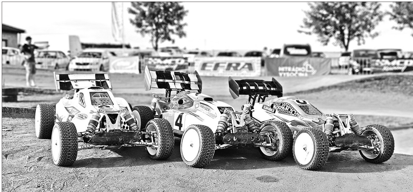
BIEDRĪBAS "RC ROTS TEAM" pārstāvju radio vadāmās mašīnas 2023. gada Eiropas čempionātā Čehijā.