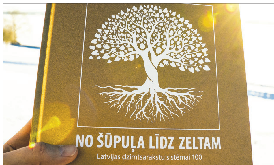
VELTĪJUMS dzimtsarakstu sistēmas simtgadei. Grāmatu "No šūpuļa līdz zeltam" saņēmušas visas Aizkraukles novada Dzimtsarakstu nodaļas darbinieces.

20 laulību reģistri sastādīti par laulībām, kas noslēgtas baznīcā. Piecas laulības reģistrētas, kurās līgavainis ir bijis ārzemnieks. Tāpat kā iepriekšējos gadus, arī aizvadītajā gadā daudzi jaunie pāri izvēlējās laulību ceremoniju ārpus Dzimtsarakstu nodaļas telpām. Vasaras mēnešos ir bijis lielākais noslēgto laulību skaits. Visvairāk laulību ārpus Dzimtsarakstu nodaļas telpām noslēgtas Koknesē. Jāvārds skanējis Daugavas krastā esošajā viesu namā "Kūpiņšala", Likteņdārzā, Kokneses viduslaiku pilsdrupās, Kokneses parka Tējas namiņā, arī viesu namā "Valteri" Aizkrauk-