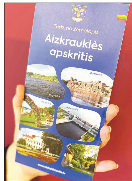
LIETUVIEŠU TŪRISTI IR IEPRIECINĀTI par 2023. gadā lietuviski tulkotajām un izdotajām Aizkraukles novada tūrisma kartēm – ar tām novada iepazīšana kļuvusi daudz ātrāka un ērtāka.

2023. gadā pirmo reizi tika pasniegta "Zemgales Tūrisma gada balva" sešās nominācijās, kurās bija izvirzīts 21 pretendents. Izcelti un sumināti tika labākie, unikālākie un eksportspējīgākie tūrisma pakalpojumu sniedzēji Zemgalē. Novads lepojas ar četriem 2023. gada balvu ieguvējiem. Nominācijā "Zemgales Zelta rokas" balvu ieguva Skrīveru