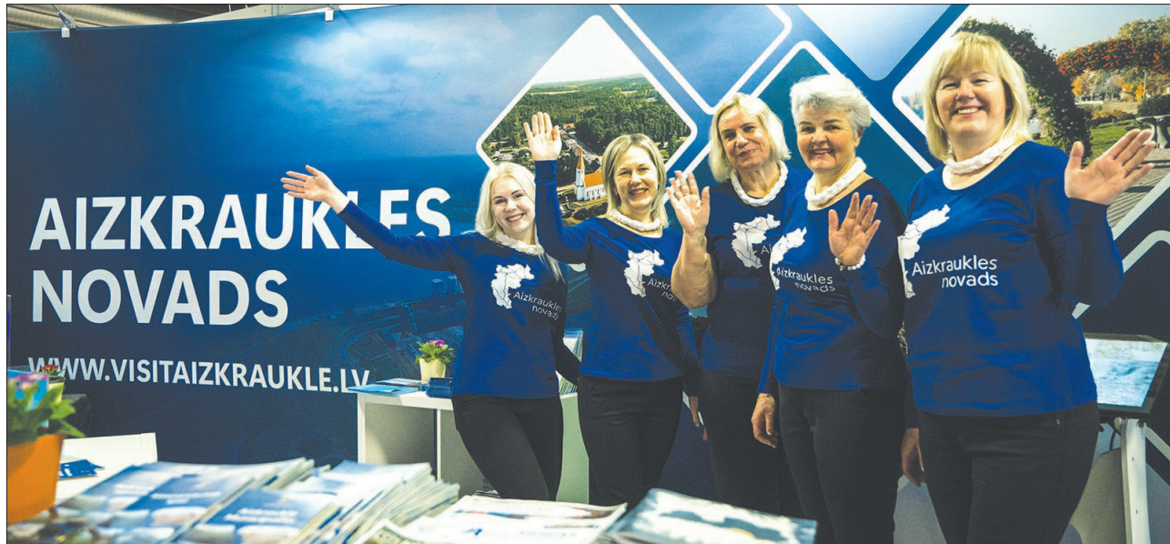
TŪRISMA IZSTĀDĒ-GADATIRGŪ "Balttour" 2023. gadā apmeklētājus sveica Aizkraukles novada Tūrisma nodaļas atraktīvās darbinieces.