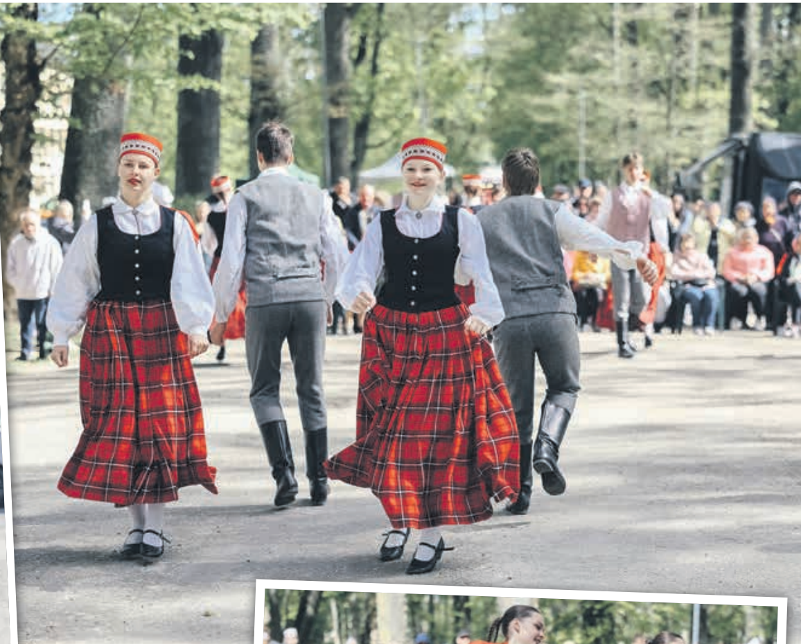
SKAISTS deju solis arī Kokneses jauniešu deju kolektīvam.