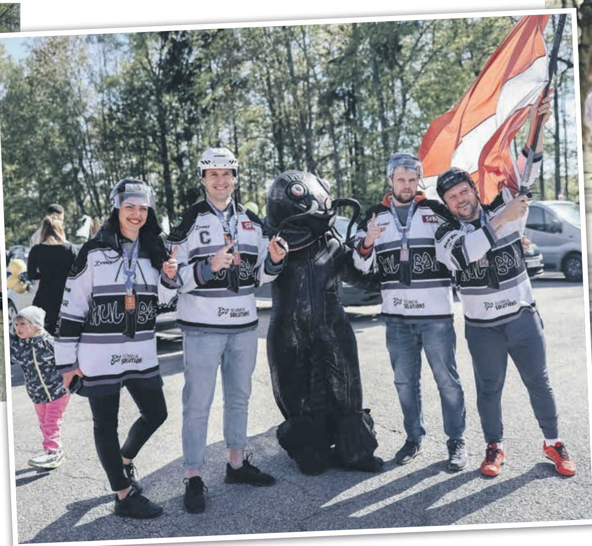
HOKEJA GAISOTNE autoorientēšanās sacensībās uzvaru palīdzēja gūt komandai "Hanza- elektro".

Iešana kalnup un lejup gan pa "Latvijas valsts mežu" labiekārtotām taciņām, gan brienot caur savdabīgu "džungļu" teritoriju un neseno cirstu krūmu apkārtni pārbaudīja pārgājiena dalībnieku spēkus un izturību. Skaista saulrieta laikā Daugavas krastā pie brīvdienas mājām "Sidrabī" pārgājiena dalīb-