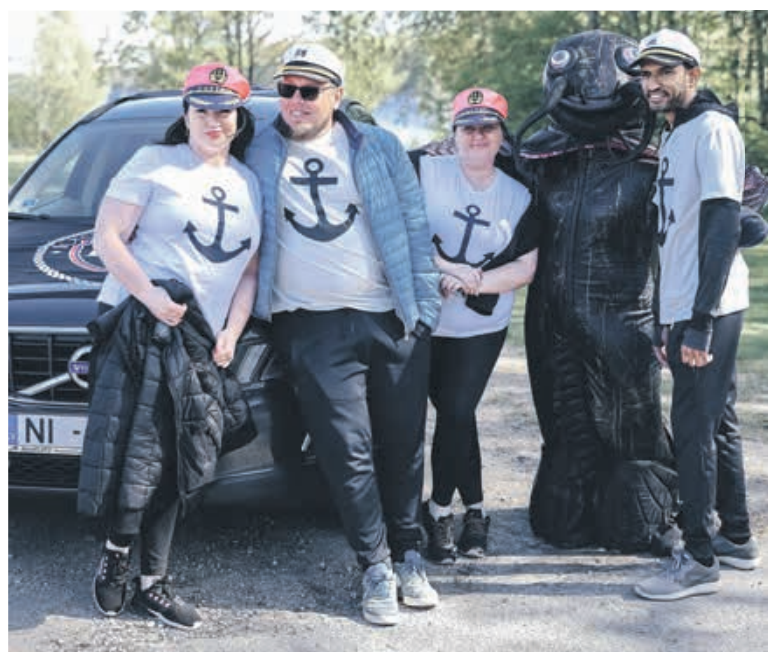
AUTOORIENTĒŠANĀS KOMANDAS iepriecināja ar atraktivitāti un izcilēm tēriem. Ceļā dodas komanda "DBS karogi".

Tradicionāli otrajā maija nedēļas nogalē Koknesē tiek atklāta aktīvā tūrisma sezona, kad koknesieši kopā ar tālākiem un tuvākiem viesiem pulcējas "Sama modināšanas svētkos".