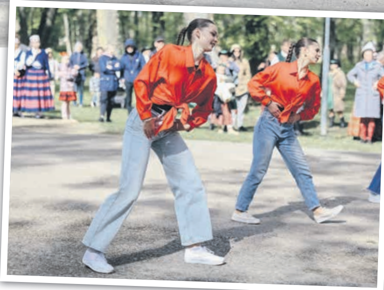
JAUTRI. Kokneses parkā visus ieliksmo linijdeju kolektīvs "Kristāliņi".

Viduslaiku pilsdrupu priekšpils teritorijā radoši darbojas Kokneses apvienības biedrības. Senās koka spēles izspēlēt piedāvāja biedrība "Baltaine", ādas apstrādes darbnīcā savu ādas piekariņu veidot aicināja biedrība "Dunense". Lielu apmeklētāju interesi izraisīja biedrības "Irši iedvesmo" ebru gleznošanas meistarklase.