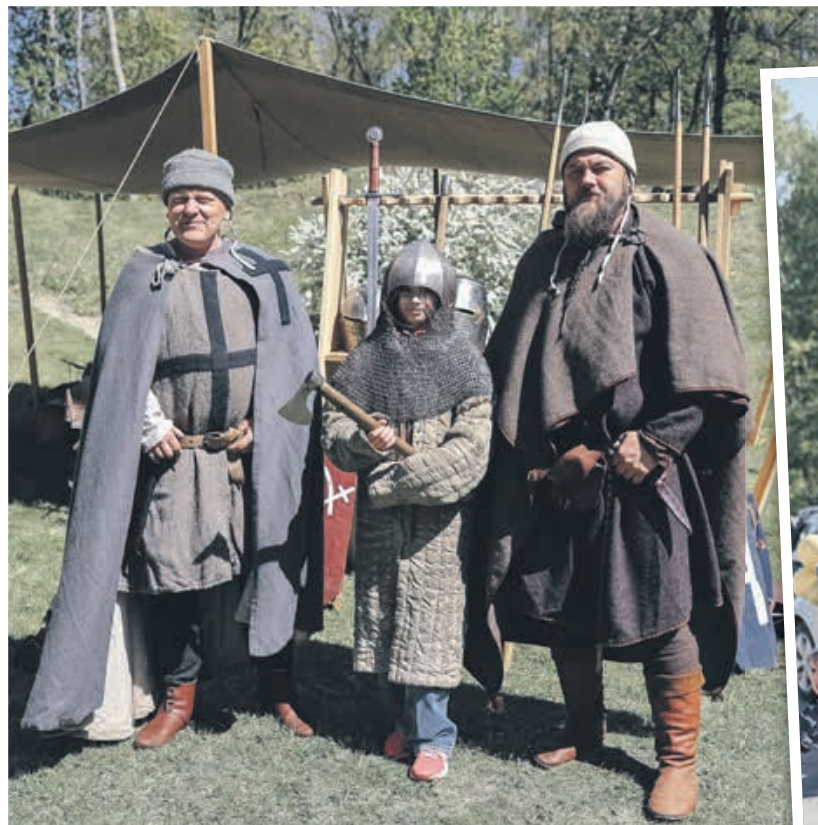
ATGRIEŠANĀS PAGĀTNĒ. Viduslaiku vēstures rekonstrukcijas kluba "Rodenpoy" pārstāvji apmeklētājus iesaistīja savdabīgā vēstures ceļojumā.