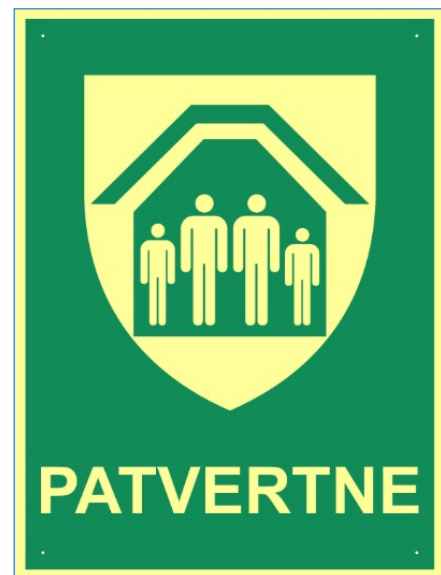
Patvertnes zīme norāda, ka apdraudējuma gadījumā ēkā var rast patvērumu.

Pašlaik spēkā esošā Valsts aizsardzības koncepcija paredz ikviena iedzīvotāja iesaisti krīžu un apdraudējumu pārvarēšanā, aicinot iedzīvotājus stiprināt savas individuālās spējas pašorganizēties un uzņemties atbildību par sevi un tuvākajiem pirmajās krīzes stundās. Tikai informēti, izglītoti un sagatavojušies iedzīvotāji varēs palīdzēt veidot spēcīgu un efektīvu civilās aizsardzības sistēmu kopumā, atbalstot arī Latvijas kopējo drošības situāciju. Mana Latvija, mana atbildība!