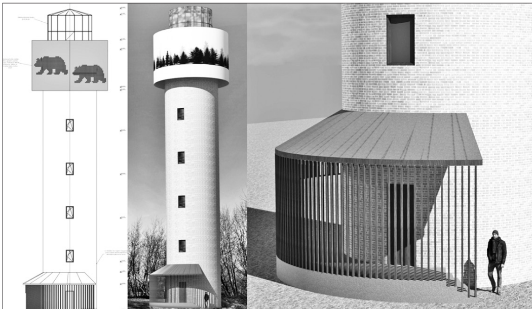
SKATU TORNIS Skrīveros, kāds tas paredzēts skicēs.

Ideju par ūdenstorna pārbūvi par skatu torni vairākkārt izteikuši paši Skrīveru iedzīvotāji, tādēļ skatu torņa izveide izvirzīta kā viens no prioritārajiem tūrisma nozares infrastruktūras attīstības projektiem Aizkraukles novadā. Šogad paredzēts izstrādāt būvprojektu, jau tapušas pirmās skices, ko sabiedrībai piedāvā izvērtēt. Būvprojekta izstrādei no pašvaldības budžeta atvēlēti 11 800 eiro (ar PVN), par šo darbu noslēgts līgums ar SIA "AD Technical Work". Savukārt, ja izdosies piesaistīt Eiropas Savienības vai citu fondu līdzfinansējumu, torņa