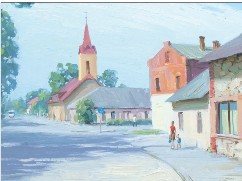
PĻAVIŅU AINAVA. Gleznas autors – Andrejs Severetņikovs.

Pļaviņu kultūras centra mazajā zālē aicinām uz izstāžu ciklu “Pļaviņu krāsu paleta”, veltītu pilsētas 95. gadu jubilejai.