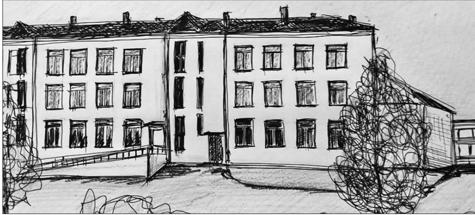
INTEREŠU IZGLĪTĪBAS CENTRS šogad svin 55 gadu jubileju. Ēkas zīmējuma autore – Ināra Plakane.

Iestāde dibināta 1967. gada 14. jūnijā, tā 1989. gadā 29. novembrī reorganizēta par Jaunrades centru, no 1999. gada 17. jūnija pārveidota par Aizkraukles pilsētas Bērnu un jauniešu centru. No 2017. gada 1. septembra, apvienojot Aizkraukles pilsētas Bērnu un jauniešu centru un Aizkraukles Pieaugušo izglītības un inovāciju atbalsta centru, strādā kā Aizkraukles Interesu izglītības centrs. No 2022. gada 1. janvāra turpina darbu kā Aizkraukles novada Interesu izglītības centrs, kuram ir divas struktūrvienī-