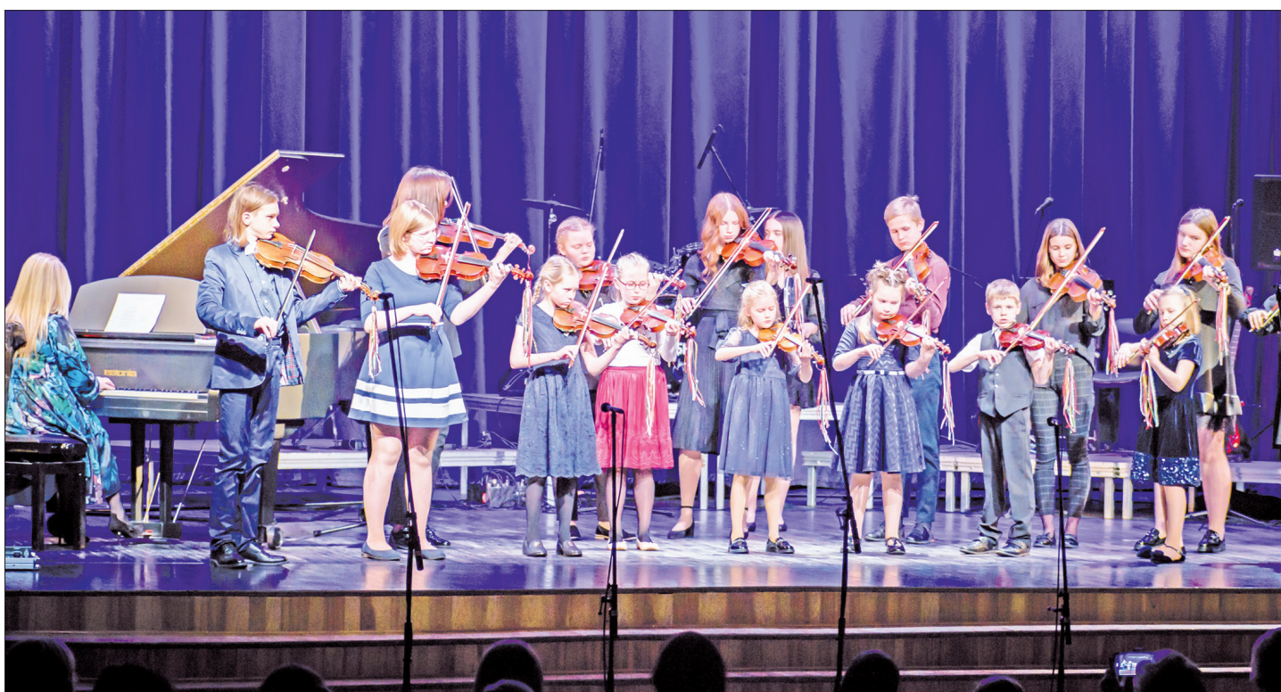
SKOLAS JUBILEJAS KONCERTS bija sirsniņš un īpašs. Koncertē P. Barisona Aizkraukles Mūzikas skolas audzēkņi.

Sveicot Aizkraukles skanīgāko skolu jubilejā, sūtam tai bijušo audzēkņu atmiņas un laba vēlējumus.