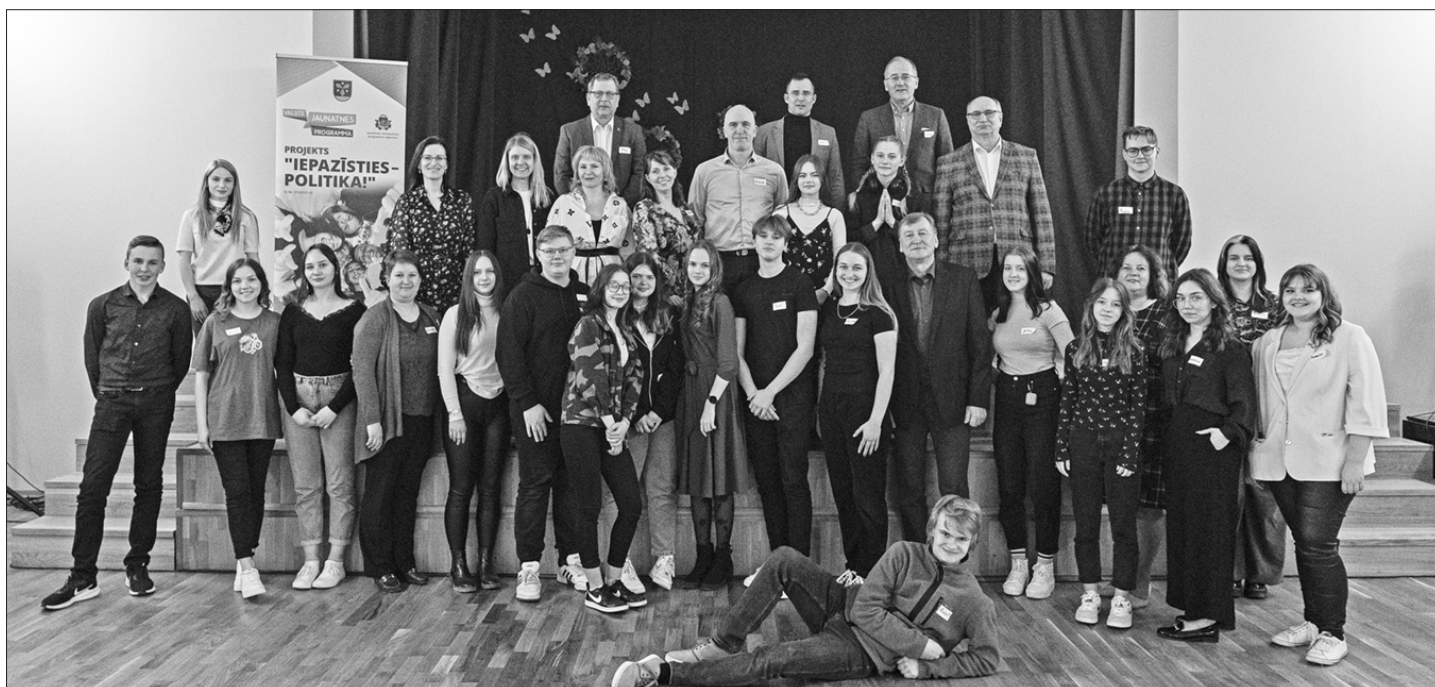
TIKŠANĀS NERETĀ. Aizkraukles novada domes deputāti un jaunieši atzina, ka nesteidzīgas sarunas ir nepieciešamas, lai iemācītos cienīt viens otru.

Pasākuma laikā aktivitātes dalībnieki tika iepazīstināti ar projekta "Iepazīsties – politika!" ideju un izvirzīto mērķi, kā arī plānotajām aktivitātēm, aicinot sekot līdz informācijai un piedalīties Aizkraukles novada Jauniešu domes izveidē.