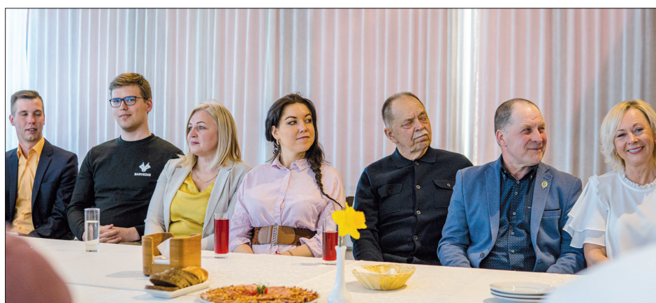
UZŅĒMĒJI ir gatavi sadarboties ar pašvaldību, un tādējādi ieguvēji būtu visi.

Priekšsēdētājs uzskata, ka uzņēmējdarbība labāk attīstīta ir tieši upju labajos krastos. Arī “Klidziņa” atrodas Daugavas labajā krastā, un Skrīveri vispār izceļas ar jaudīgu rīcību, bet arī kreisajam krastam ir iezīmēta attīstība, jo investori meklē iespēju sadarboties, piemēram, kaut vai izveidot vēja