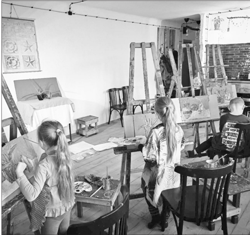
TOP mazo mākslinieku darbi.