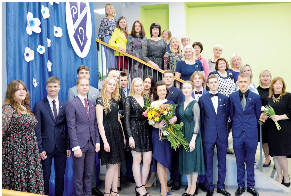
ĪPAŠS MIRKLIS. Pļaviņu vidusskolas abiturienti un skolotāji Žetona vakarā.